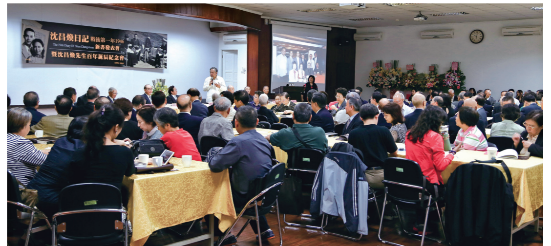
▲102年10月12日國史館舉辦「沈昌煥日記新書發表會暨沈昌煥先生行誼座談會」，座無虛席。

就在這一年，蔣委員長的抗戰勝利建國，復興中華民族的壯志，付諸春夢，不到四年間，受逼退守台灣，大好萬里山河，付諸「東流」。輸在那裡？可謂敵我實力分明，以裝備、人員論，