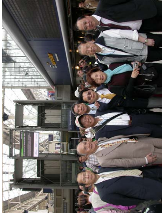
▲倫敦滑鐵盧車站留影。

離去時，為了避開會議室牆上某位「百變天王」的照片，而改於一樓合照，真是煞費苦心。