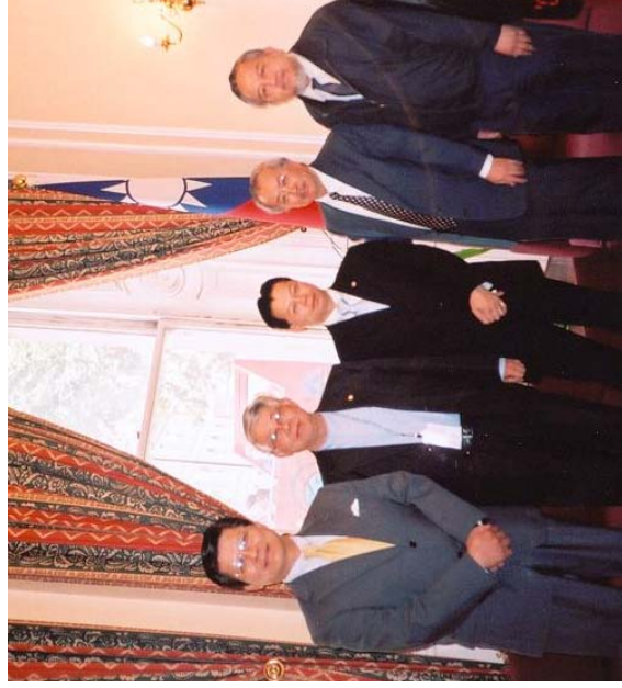
▲拜會駐英台北代表處。

在他五十七歲的生涯中寫了卅七部偉大的戲劇作品，歷數百年而不衰，有悲劇、有喜劇，將人性最原始的一面藉由戲劇表現出來。在他故鄉的街道上，樹立一座丑角塑像，寫著小丑是高貴的，它照亮了每個地方。的確，丑角帶來歡笑，人生就是這麼回事，生不帶來，死不帶去的，何必道貌岸然，偽裝自己呢？