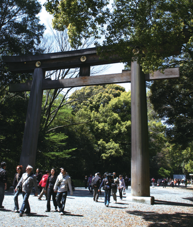
▲東京明治神宮九十多年歷史，表參道的大鳥居係以台灣檜木（樹齡1500年，長12米、直徑1.2米）建構而成。