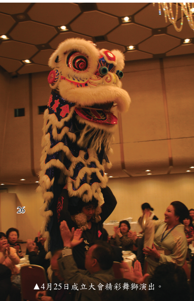
▲4月25日成立大會精彩舞獅演出。

總之，祝賀團此次日本行，團員無論在精神領略、調劑身心、增進友誼、見聞、血拼上，都各有豐收。真是不虛此行。（作者為本會會員）