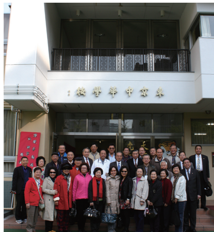
▲祝賀團留影於東京中華學校。