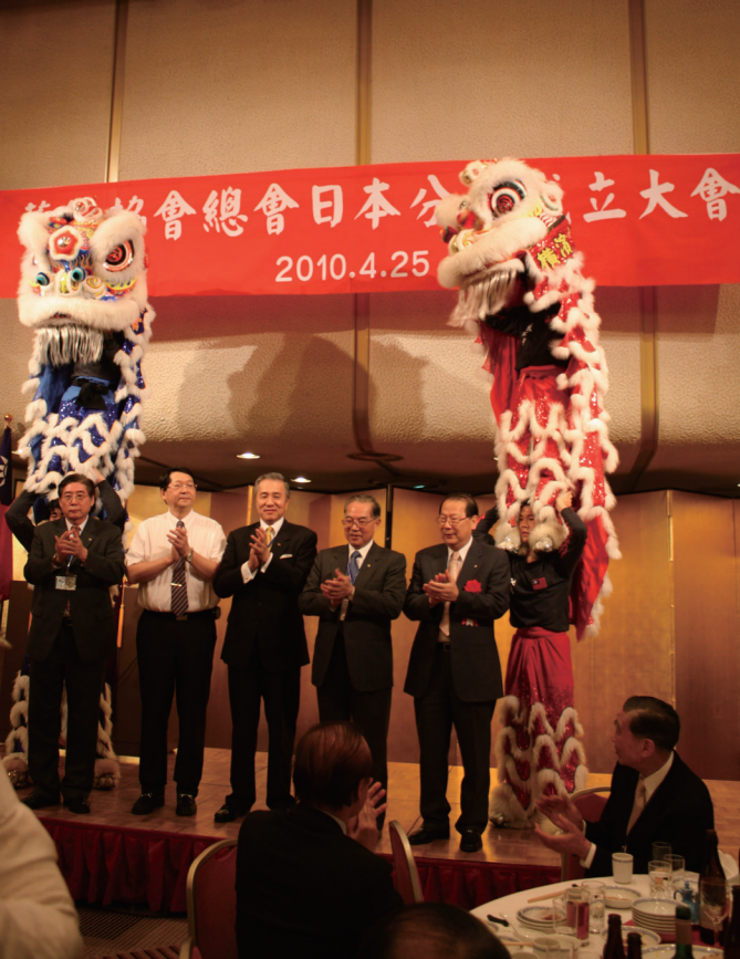
▲橫濱中華學院舞獅演出，真功夫，精彩好勁道。