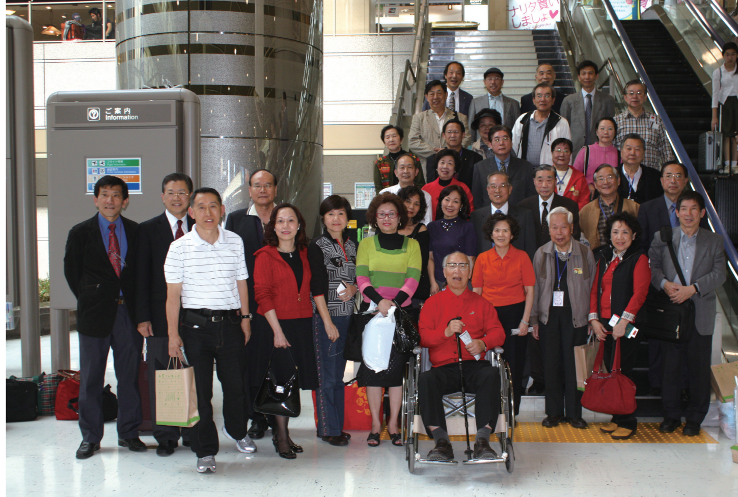
▲4月29日下午祝賀團結束日本之行，日本分會友人前來送行合影。

習慣已經完全西化，才能有今日富強。清末有思想的人，如重臣張之洞提出「中學為體、西學為用」主張，上個世紀被主張「全盤西化」人批評得體無完膚，說他還是擺不脫舊思想束縛，會使國家進步滯礙難行。我們這次參觀「明治神宮」，在入口處就看到有關明治天皇功績的簡略說明。它說，明治天皇訂下來的日本教育方針是「和魂洋才」，還特別以英文翻譯為「Japanese spirit and western knowledge」，這不就是張之洞的「體」「用」思想？例如，他們的國教並非天主教或基督教，而是神道教。這就證日本並沒有「全盤西化」。在追求現代化的道路上，一百多年來，我們還在原地為應否「全盤西化」爭論不休，