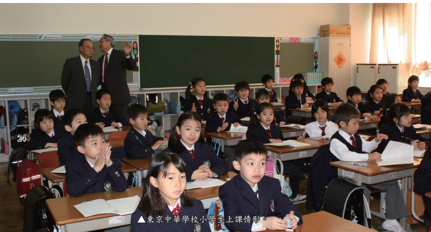
▲東京中華學校小學生上課情形。