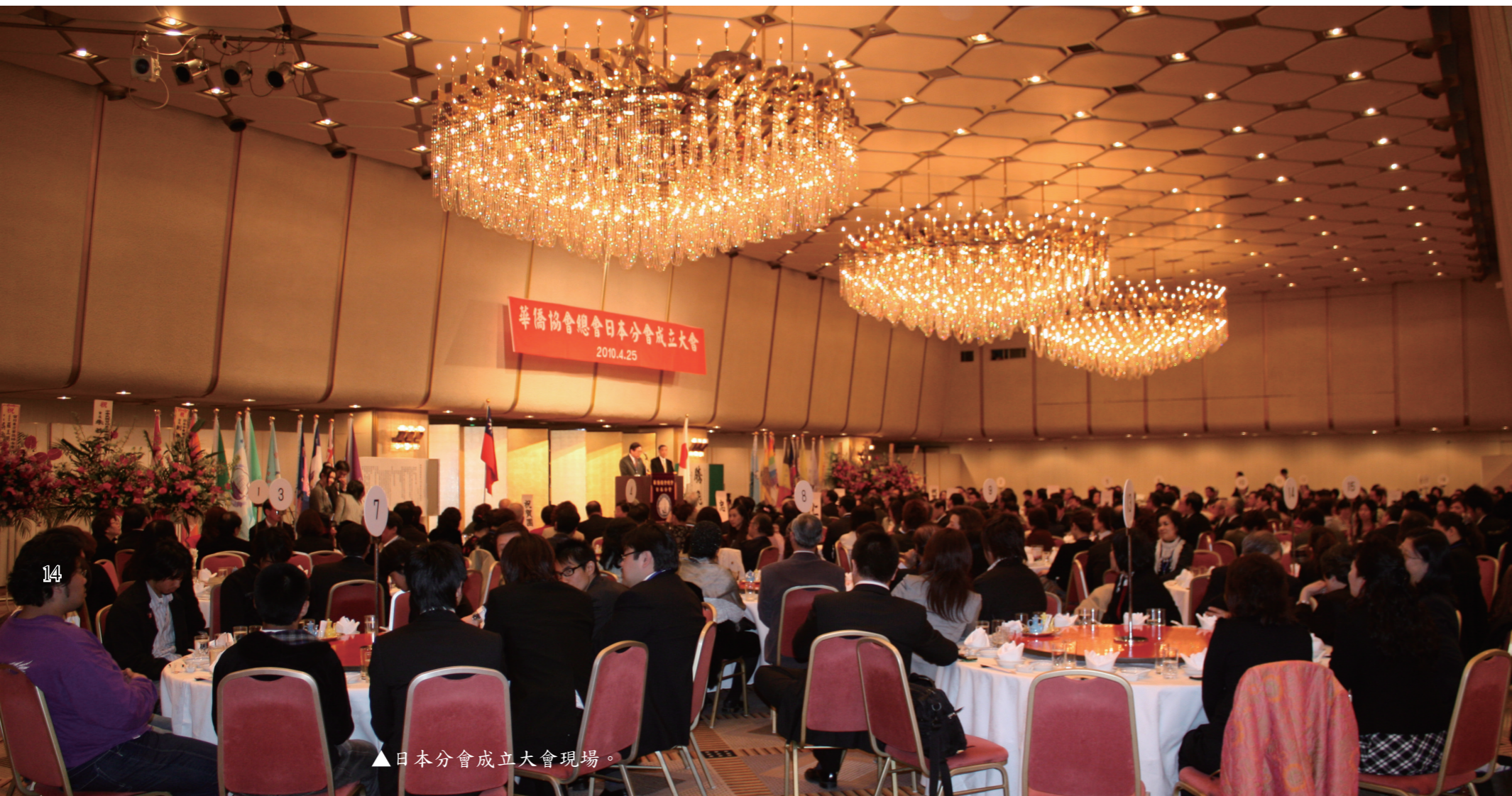
▲日本分會成立大會現場。